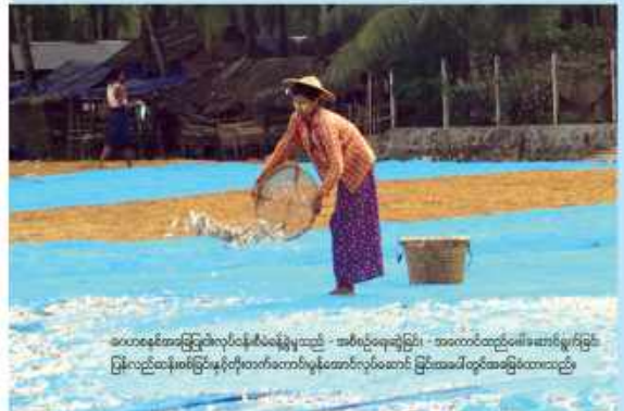
ခေတ်မီစီမံခန့်ခွဲမှုလုပ်ငန်းစီမံခန့်ခွဲမှုသည် အစီစဉ်ရေးဆွဲခြင်း၊ အထောက်အကူပြုခြင်း၊ အားပေးမှုကို မြှင့်တင်ပေးခြင်းဖြစ်သည်။