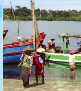
အခြားပုံစံ ဝေပေးခြင်း ၀

ဝါဒများအပေါ်အခြေပြုငါးလုပ်ငန်းစီမံခန့်ခွဲမှုစီမံခန့်ခွဲမှုအတွက် ပိုမိုကောင်းမွန်သည့် အလုံးစုံထည့်သွင်းစဉ်းစားထားသည့် နည်းလမ်းတစ်ခုဖြစ်သည်။