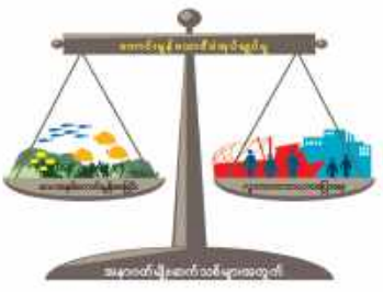
ဂေဟစနစ် အခြေပြုငါးလုပ်ငန်းစီမံခန့်ခွဲမှု

ခေတ်မီစီမံခန့်ခွဲမှုလုပ်ငန်းစီမံခန့်ခွဲမှုသည် ခေတ်မီစီမံခန့်ခွဲမှုအား အားပေးခြင်းနှင့် အားပေးမှုကို မြှင့်တင်ပေးခြင်းဖြစ်သည်။ ခေတ်မီစီမံခန့်ခွဲမှုလုပ်ငန်းစီမံခန့်ခွဲမှု = ခေတ်မီစီမံခန့်ခွဲမှုလုပ်ငန်းစီမံခန့်ခွဲမှု